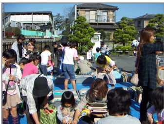
(写真は以前のものです)