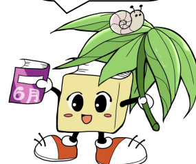
毛呂山町立図書館キャラクター ブックサタ