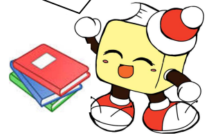
毛呂山町立図書館キャラクター ブックサンタ