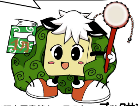
毛呂山町立図書館キャラクター ブックサンタ