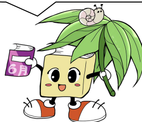
毛呂山町立図書館キャラクター ブックサタ