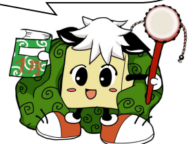
毛呂山町立図書館キャラクター ブックサンタ