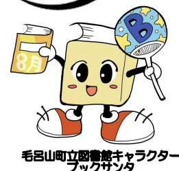
毛呂山町立図書館キャラクターブックサンタ

<毛呂山町立図書館> 住所 毛呂山町岩井西4-18-1 電話 295-1015 / FAX 294-8623 開館時間 火~金 9:30~19:00 / 土日祝日 9:30~17:30 <図書館URL> http://www.library.moroyama.saitama.jp <毛呂山町URL> http://www.town.moroyama.saitama.jp