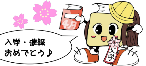
毛呂山町立図書館キャラクターブックサンタ