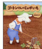
『ゴートンさんのじゃがいも』 赤ちゃんとママ社