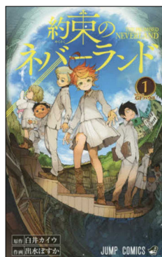
『約束のネバーランド』全20巻 出水 ぽすか／著 集英社 P726.1 デ(閉架に所蔵)