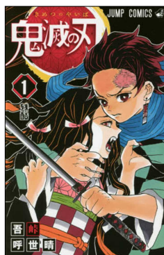
『鬼滅の刃』全23巻 吾峠 呼世晴／著 集英社 P726.1 ゴ(閉架に所蔵)