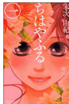
『ちはやふる』1～45巻 末次 由紀／著 講談社 P726.1 ス(漫画コーナー)