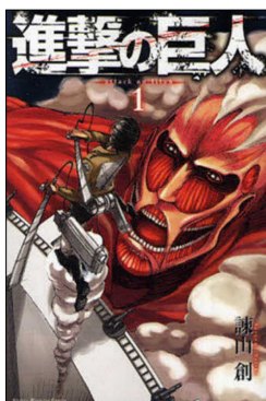
『進撃の巨人』1～33巻 諫山 創／著 講談社 P726.1 イ(閉架に所蔵)