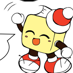
毛呂山町立図書館キャラクター ブックサンタ