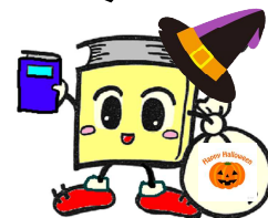
ブックサンタ 毛呂山町立図書館キャラクター