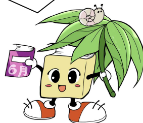
毛呂山町立図書館キャラクター ブックサンタ