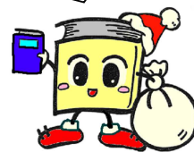
毛呂山町立図書館キャラクター ブックサンタ