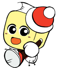
毛呂山町立図書館キャラクター ブックサンタ