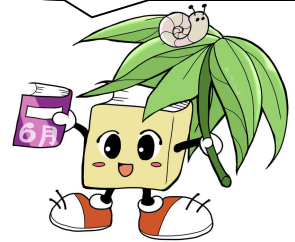
毛呂山町立図書館キャラクター ブックサンタ