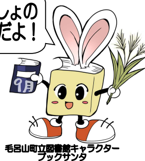
毛呂山町立図書館キャラクター ブックサタ