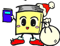
毛呂山町立図書館キャラクター ブックサンタ