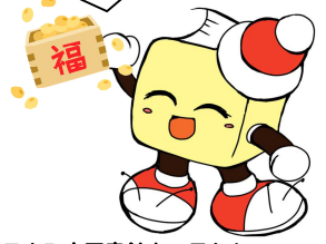
毛呂山町立図書館キャラクター ブックサンタ