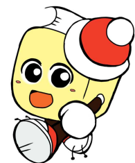
毛呂山町立図書館キャラクター ブックサタ