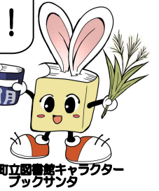
毛呂山町立図書館キャラクター ブックサンタ